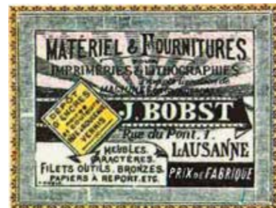
1893: Première publicité pour la société.