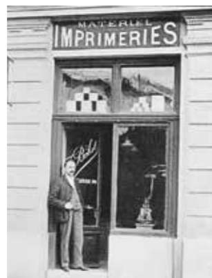
Un magasin ouvre au Flon, à Lausanne, en 1904 .

Le premier logo , créé en 1915, utilise la roue dentée comme emblème.