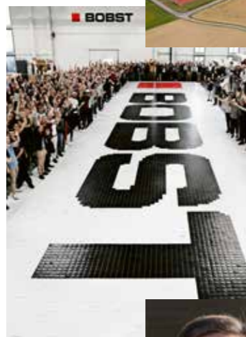
2018: Les employés construisent la plus grande mosaïque en carton du monde.